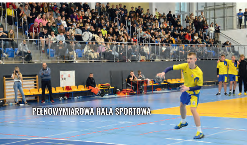
PEŁNOWYMIAROWA HALA SPORTOWA

Profil stworzony został z myślą o przyszłych inżynierach, architektach, informatykach i ekonomistach. Wybór tego oddziału umożliwi Ci zdobycie solidnych podstaw teoretycznych i praktycznych z matematyki i informatyki. Szczególnie zapraszamy do tej klasy osoby gotowe do twórczego rozwiązywania problemów, które bazować będzie na sztuce logicznego myślenia oraz wyciągania precyzyjnych wniosków. Uczniowie tego profilu zdobywać będą umiejętności kreowania wirtualnej rzeczywistości oraz wykorzystywania informatycznych narzędzi użytkowych. Zależy nam, by absolwenci tego kierunku jednoznacznie byli przekonani o tym, że teoria służy praktyce z uwzględnieniem idei, że praktyka odświeża nowe podłoża teoretyczne.